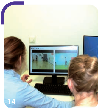
Bij een controleafspraak doen we een gangbeeldanalyse met videobeelden